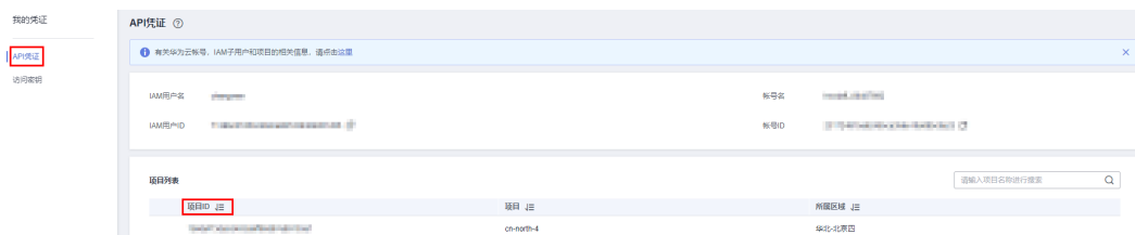
图 5-1 查看项目 ID